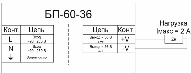
Рисунок 2 - Варианты схем подключения

После крепления блока необходимо подключить питание и нагрузку соблюдая полярность в соответствии со схемой на рисунке 2.