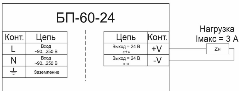
Рисунок 2 - Варианты схем подключения

После крепления блока необходимо подключить питание и нагрузку соблюдая полярность в соответствии со схемой на рисунке 2.