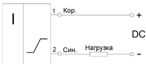
Рисунок 1 - Вариант схемы подключения датчиков

3.5 Датчики настроены на ток 1,55мА в нагрузке 1 кОм при номинальном расстоянии до объекта воздействия и напряжении питания 8,2В.